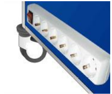
REGLETA CONEXIONES DEH-15