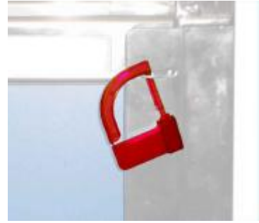
CIERRE CANDADOS SEGURIDAD DEH-21