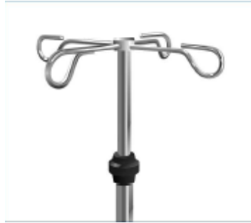
PORTASUERO 4 GANCHOS