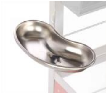
BATEA ARIÑONADA DEH-13