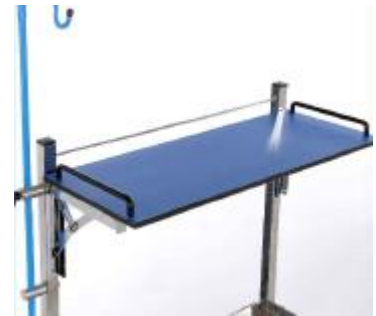
ESTANTE SUPERIOR ABATIBLE DEH-18