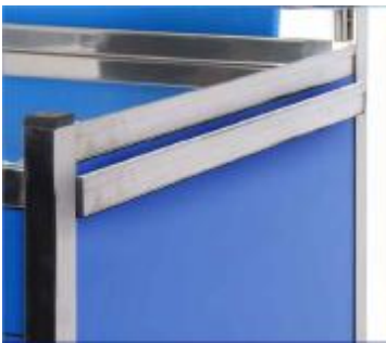
SOPORTE RAIL LATERAL DEH-22