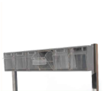
MÓDULO 6 CAJETINES BASCULANTES