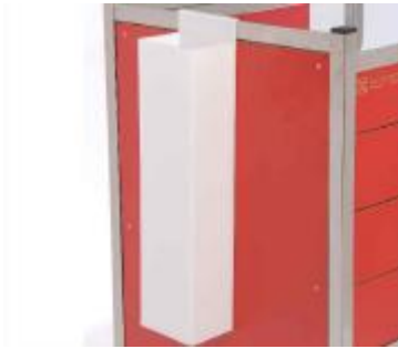
SOPORTE CATETER DEH-11