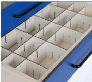
SEPARADORES INTERIOR CAJÓN