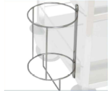
SOPORTE BOTELLA GAS