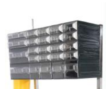
MÓDULO CAJETINES EXTRAIBLES