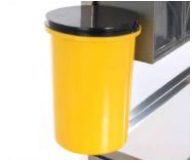
SOPORTE BOTE DESECHABLE DEH-12