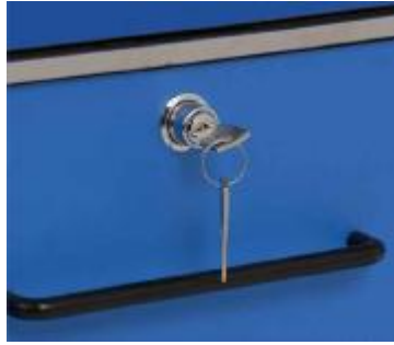
CIERRE CON LLAVES DEH-20