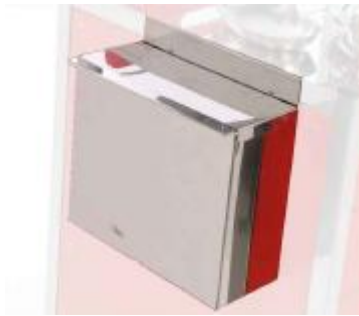
PAPELERA ACERO INOX. DEH-14