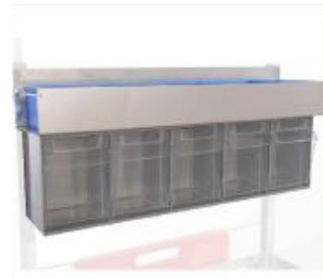
MÓDULO 5 CAJETINES BASCULANTES