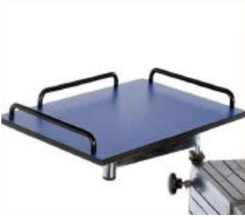
SOPORTE MONITOR ORIENTABLE DEH-19