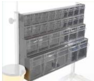
ARCO CAJITAS BASCULANTES