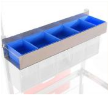
SOPORTE SUPERIOR AUXILIAR DEH-10