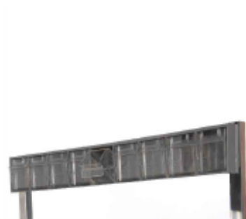
MÓDULO 9 CAJETINES BASCULANTES