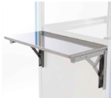
ESTANTE LATERAL ABATIBLE DEH-17